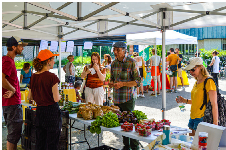
Marché de producteurs à Grenoble

" Les réunions nationales avec les autres villes étaient sympa, elles permettaient de savoir ce qu'il se passait ailleurs et de partager nos idées."