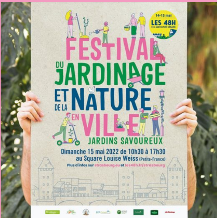
Jardins savoureux à Strasbourg