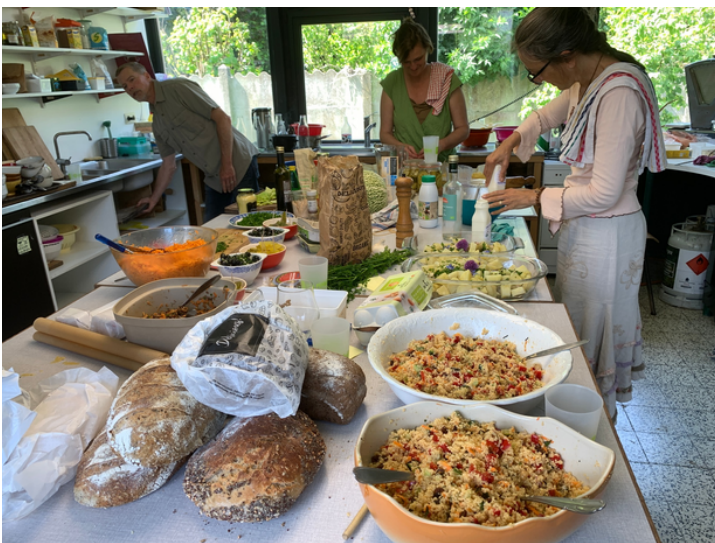
Atelier cuisine à Tournai