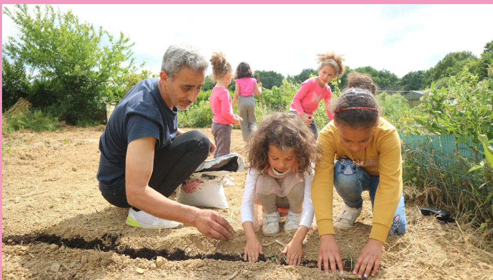
Les mains dans la terre avec Génération verte à Rennes

"Cette édition a amené un nouveau public qui permet une nouvelle forme de mixité"