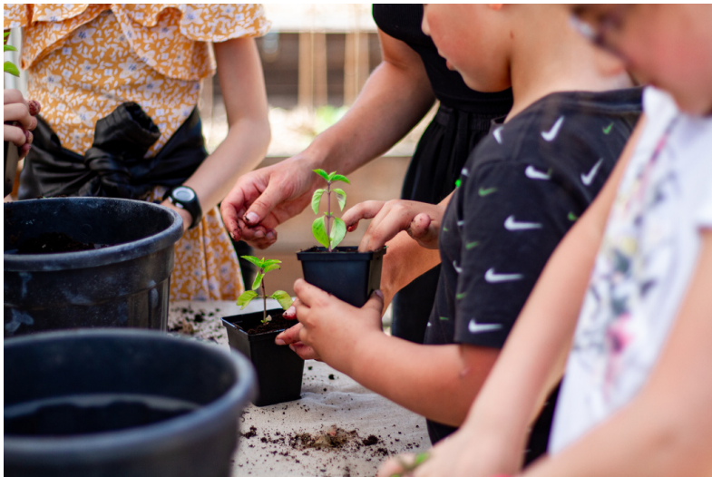
Atelier semis à Terre Terre - Aubervilliers