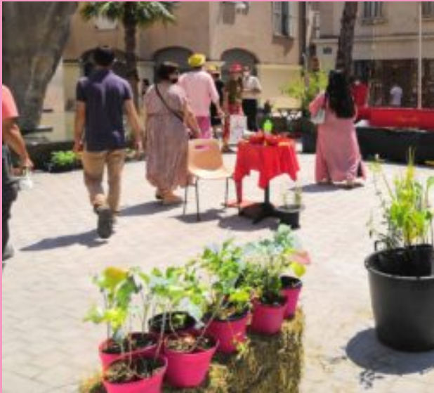
Semis, semences, fleurs & potager à Toulon

" Les 48h avaient lieu en même temps que le Forum Nature en ville, le programme était donc foisonnant cette année ! "