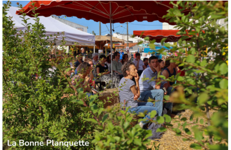
La Bonne Planquette

" Nous avons expérimenté cette année l'après pro, d'où s'est dégagé une belle énergie collective."