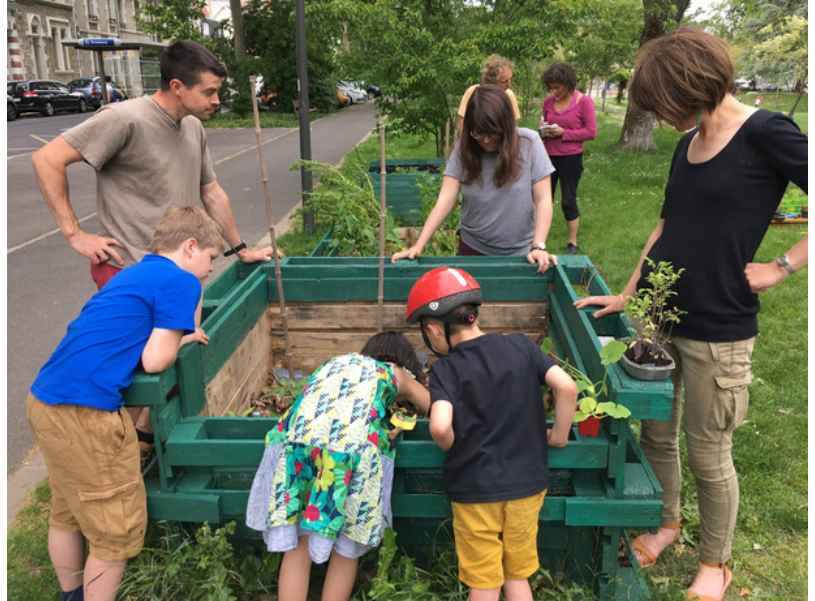
Découverte des jardinières masquées à Tours

"Pour une première édition, les Tourangeaux ont été nombreux à avoir participé au festival et nous les en remercions."