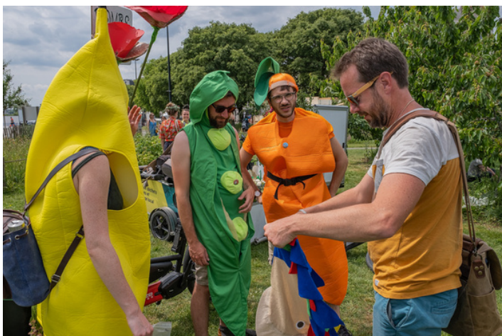
Végéparade à Nantes